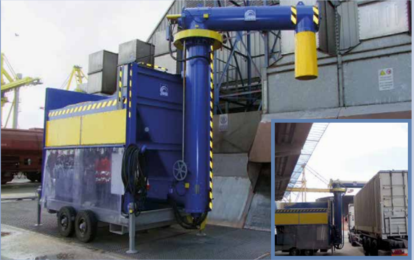
■ Spedizione del prodotto polverulento con sistema di pesatura