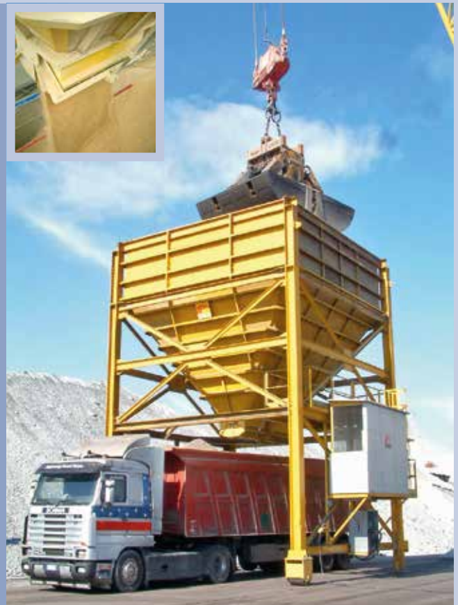
■ Sistema di trasbordo da nave a camion tramite tramogge di carico alla rinfusa