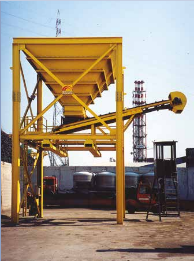
■ Tramoggia con trasportatore a nastro per carico su camion, vagoni