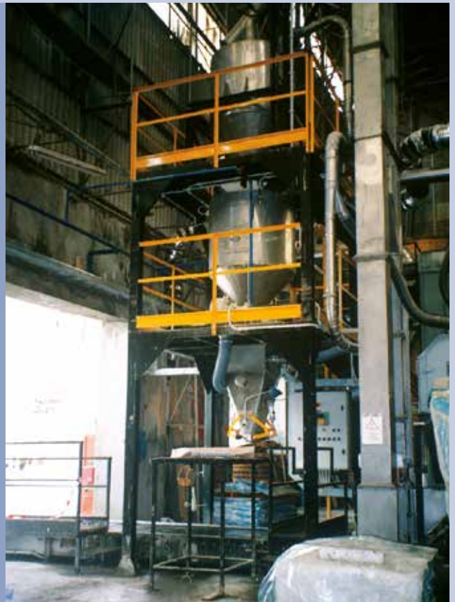
■ Insacco BIG BAGS a peso netto