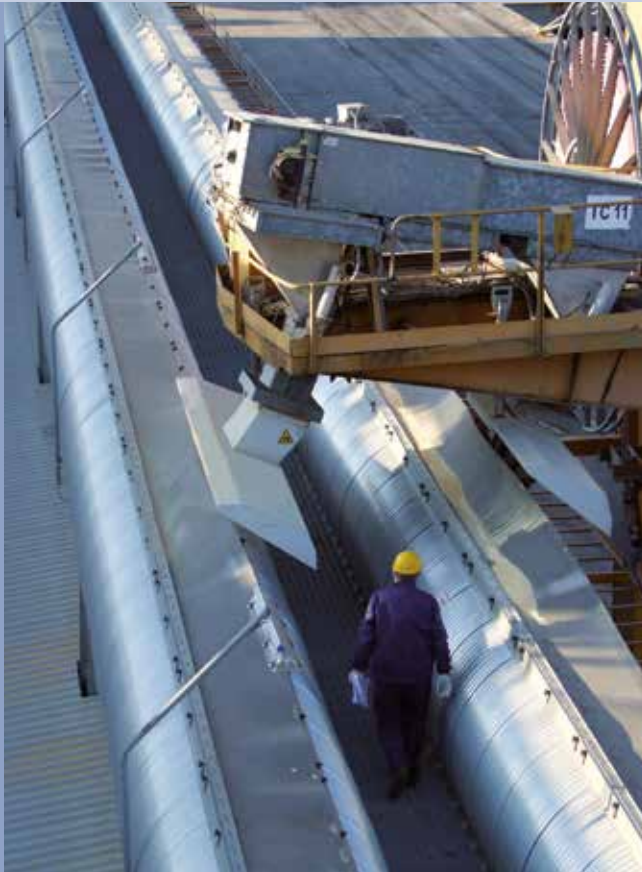
■ Trasportatori a nastro su banchina