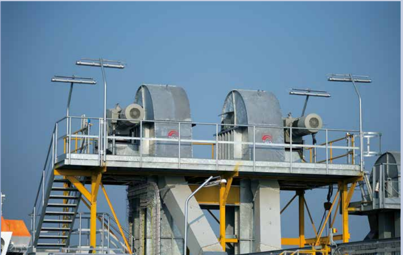
■ Gruppo testa elevatore