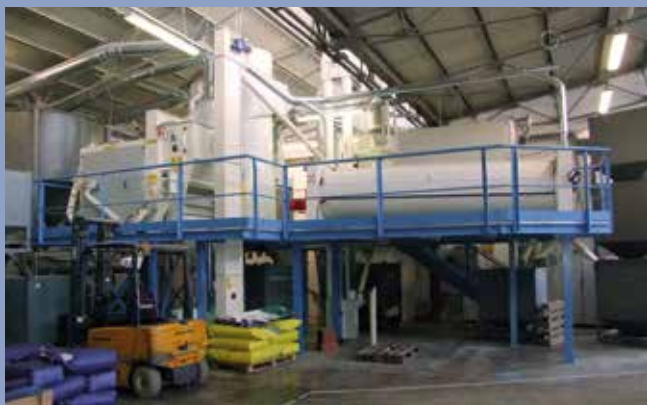
■ Selezione sementi