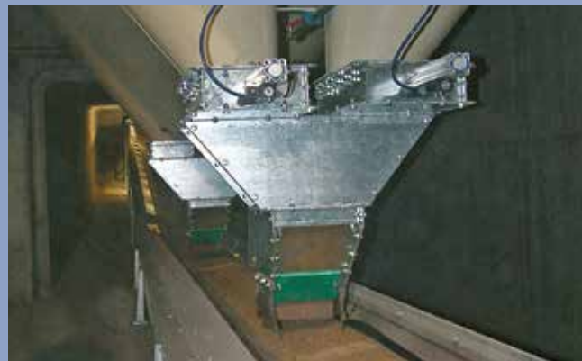
■ Fase di scarico da silos a celle quadre