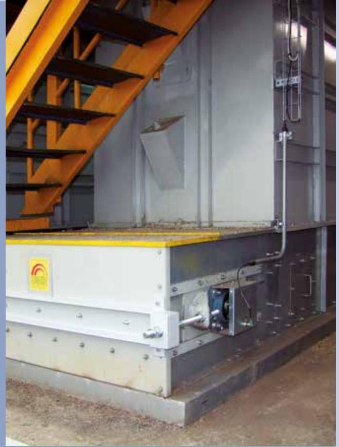
■ Sistema di pesatura in continuo con trasportatori di scarico