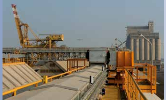
■ Impianto da sbarco