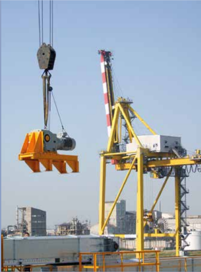
■ Motorizzazione trasportatori