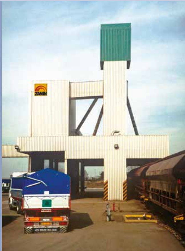
■ Impianto di ricezione con carico rapido e trasportatore per invio a magazzino