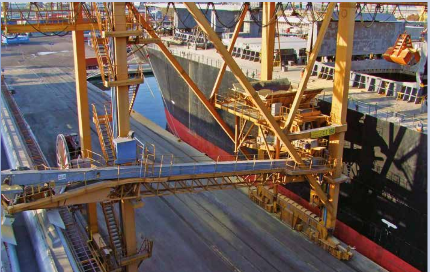
■ Linee di sbarco da nave su magazzino