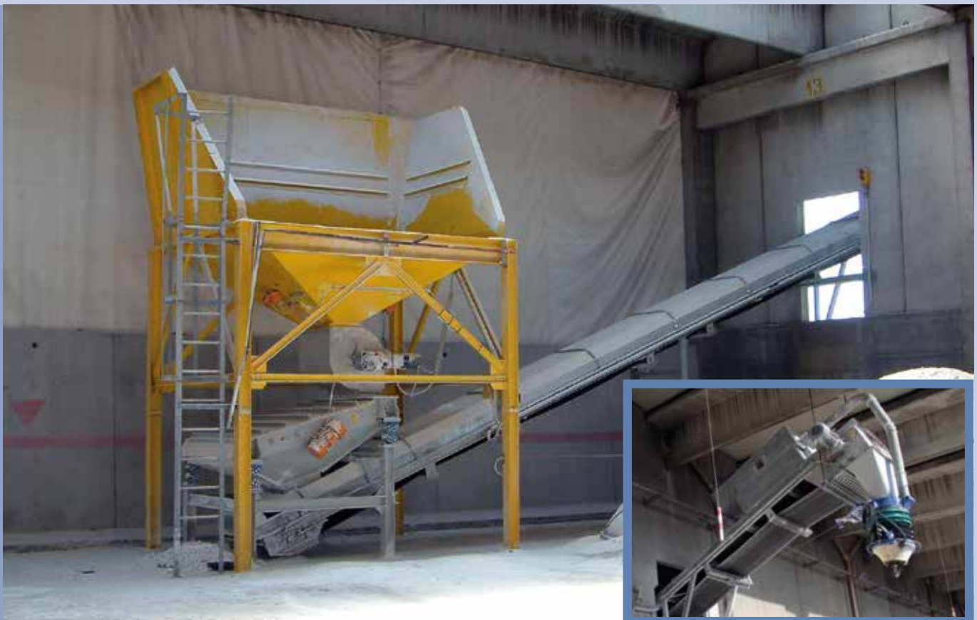
■ Riconsegna prodotti su camion, con vagliatura