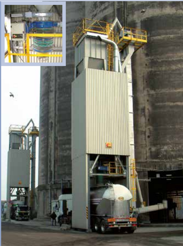
■ Impianto di riconsegna prodotti