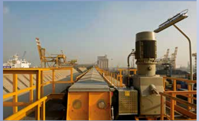
■ Trasportatore a catena per carico magazzino