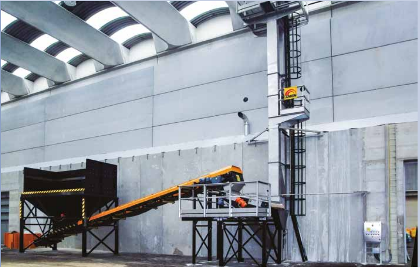
■ Linea insacco fertilizzanti