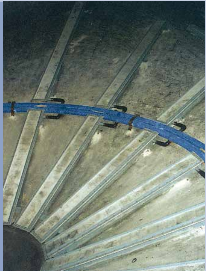
■ Canalette di fluidificazione per coni silos