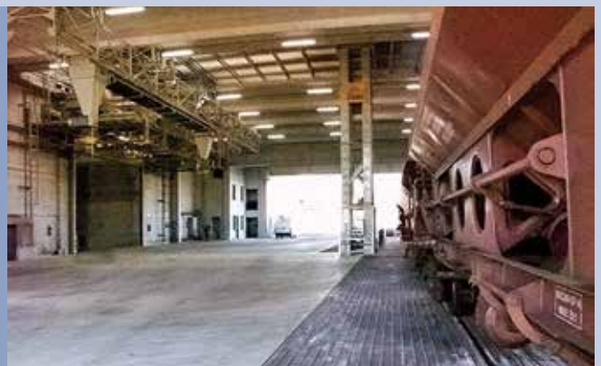
■ Impianto di scarico vagoni con pesa e annesse celle di stoccaggio robotizzate