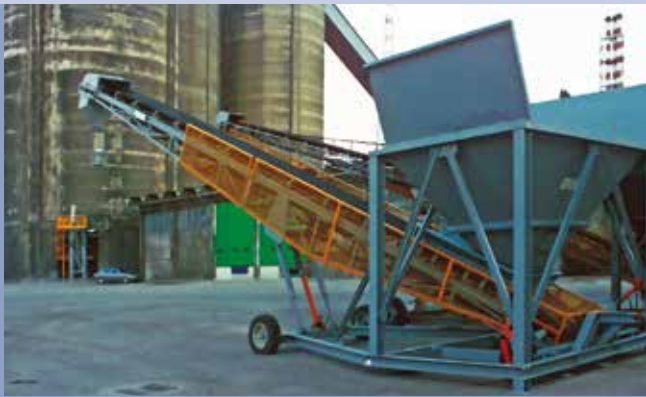
■ Caricatore a nastro per autotreni - vagoni ferroviari con tramoggia e pesatura in continuo