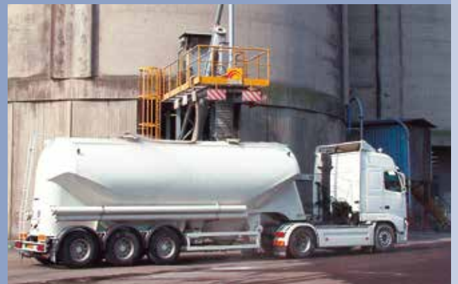
■ Riconsegna con pala meccanica a carico camion cisterna o vagone