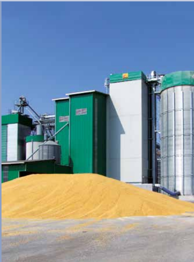
■ Impianto di essiccazione cereali con essiccatoio CR completo di raffreddatore lento.