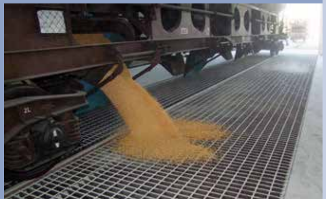
■ Fase di scarico vagoni su tramoggia