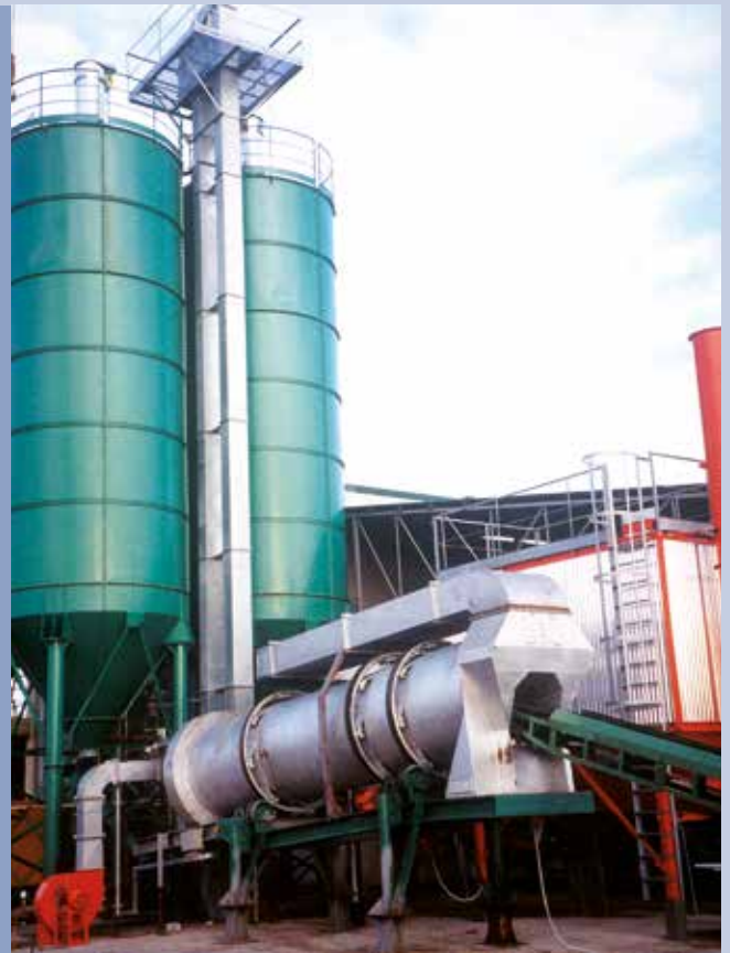
■ Elevatori a tazze per sabbie