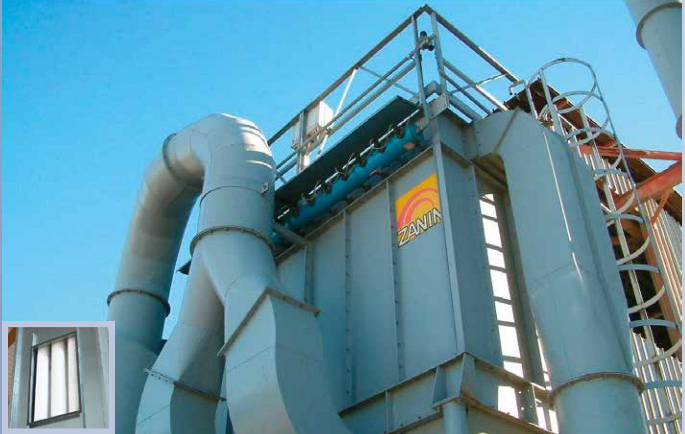
■ Filtro autopulente