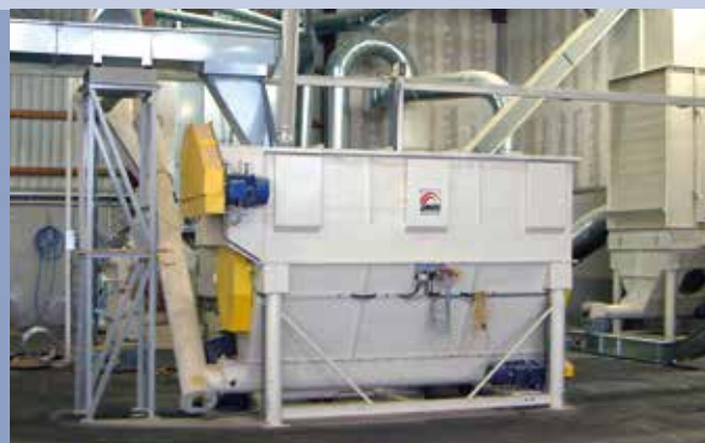
■ Impianto produzione pellet