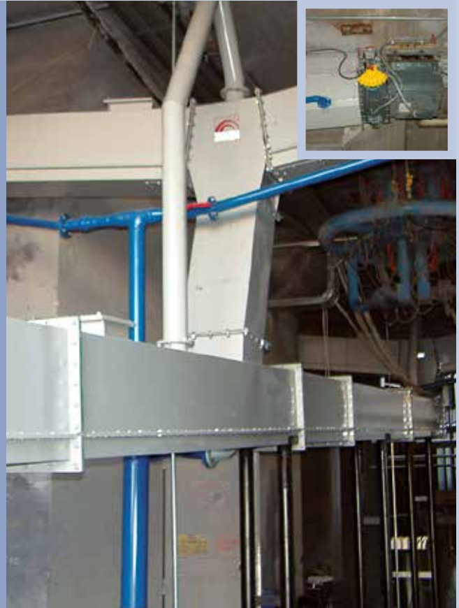
■ Canalette fluidificanti per trasporto cenere-cemento