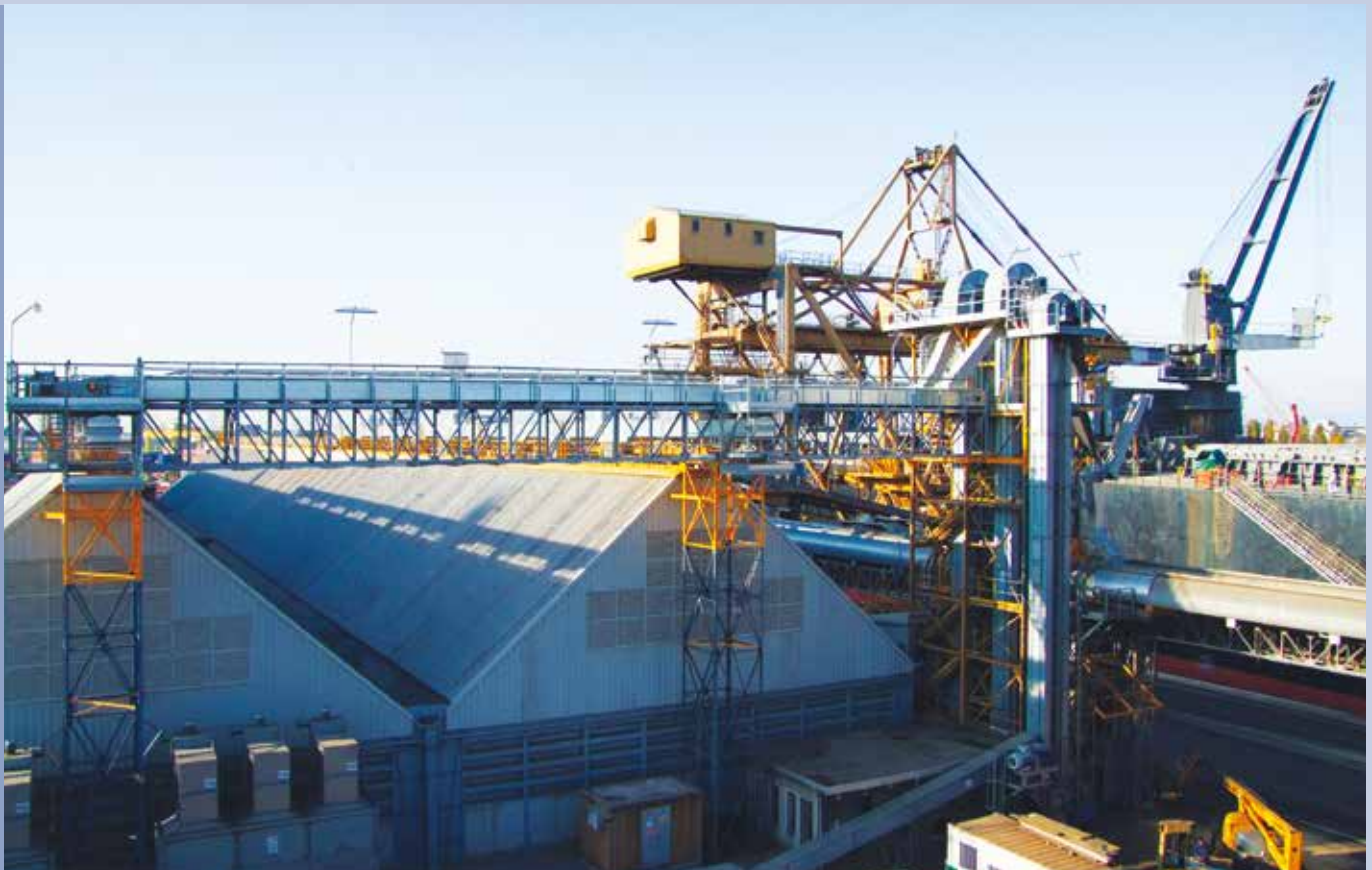
■ Trasportatore di carico magazzini