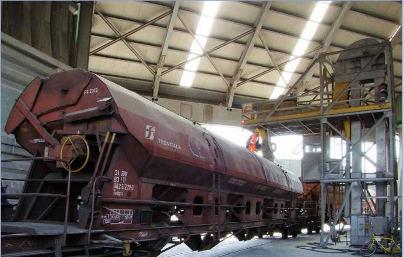
■ Impianto trasbordo farine da camion a vagoni treno