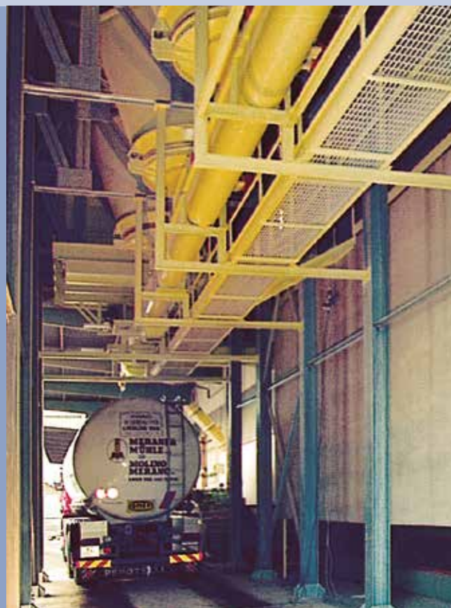
■ Carico rapido con miscelazione prodotti