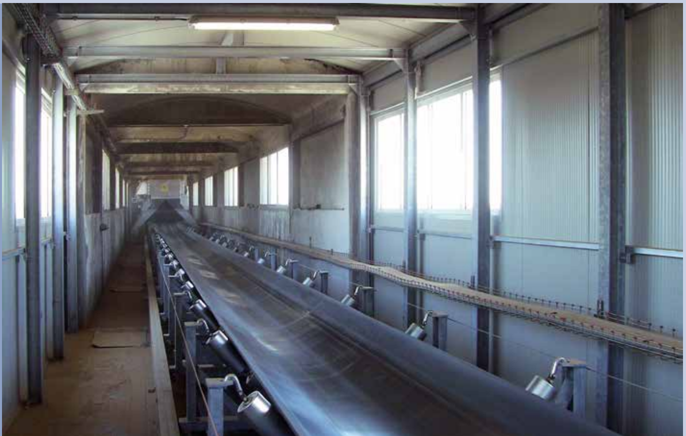
■ Trasportatore a nastro