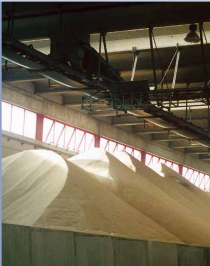
■ Stoccaggio a magazzino con trasportatore nastro