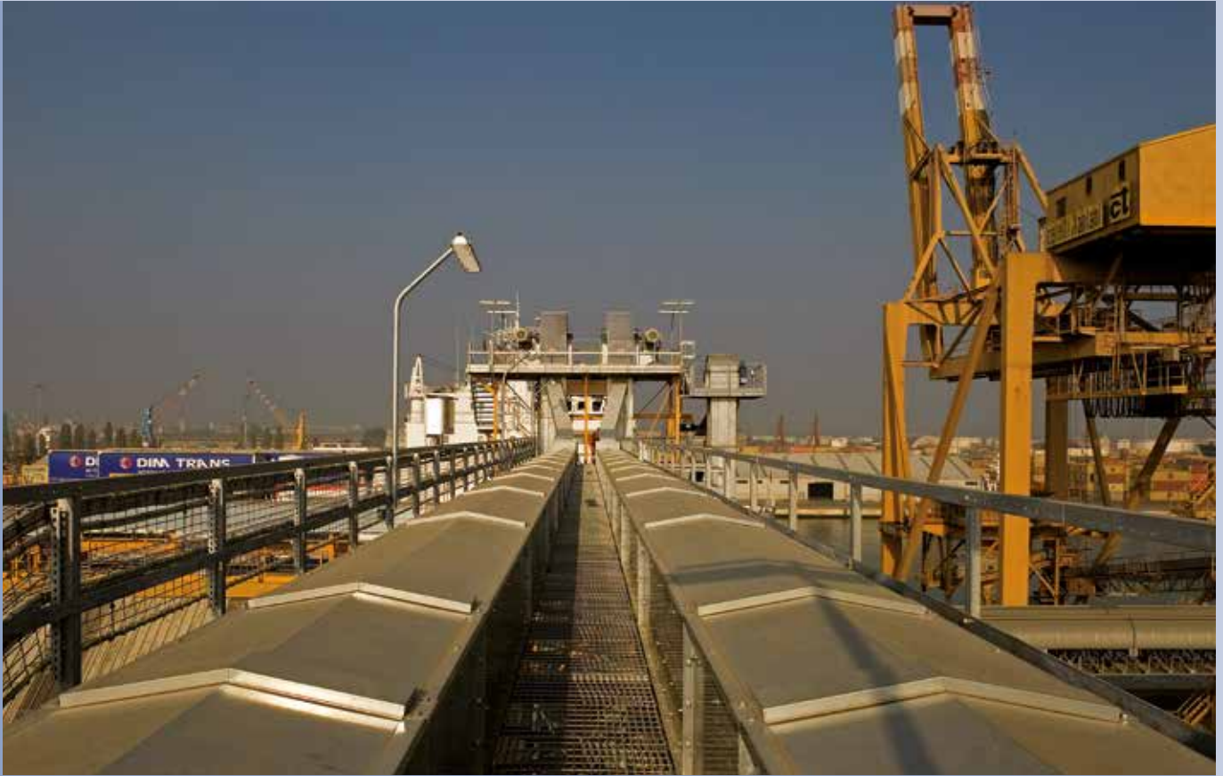
■ Elevatore a tazze per carico trasportatore a catena