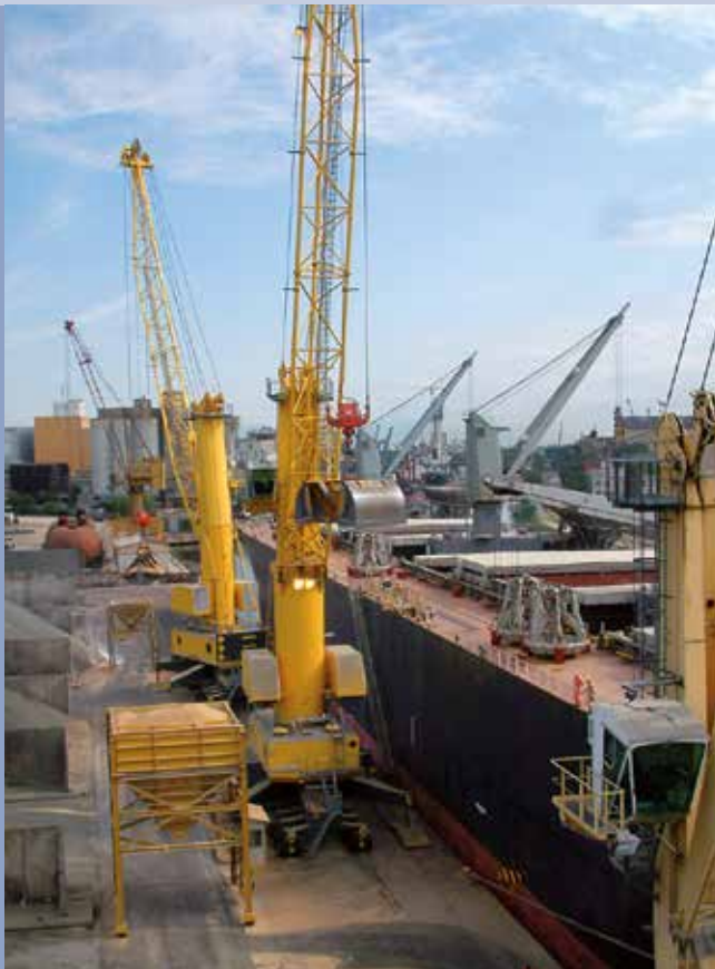
■ Sistema di trasbordo da nave a camion tramite tramogge di carico alla rinfusa