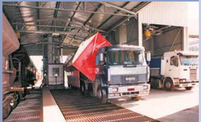
■ Tramoggia pesatrice vagoni con annessa tramoggia per camion con ribaltatore idraulico