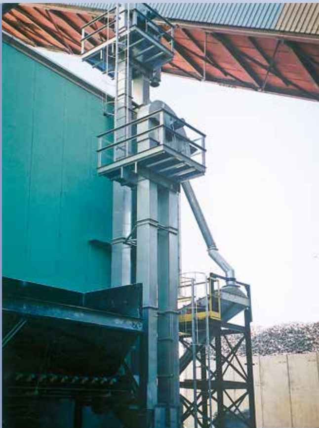
■ Elevatore inox con vibrovaglio e tramoggia