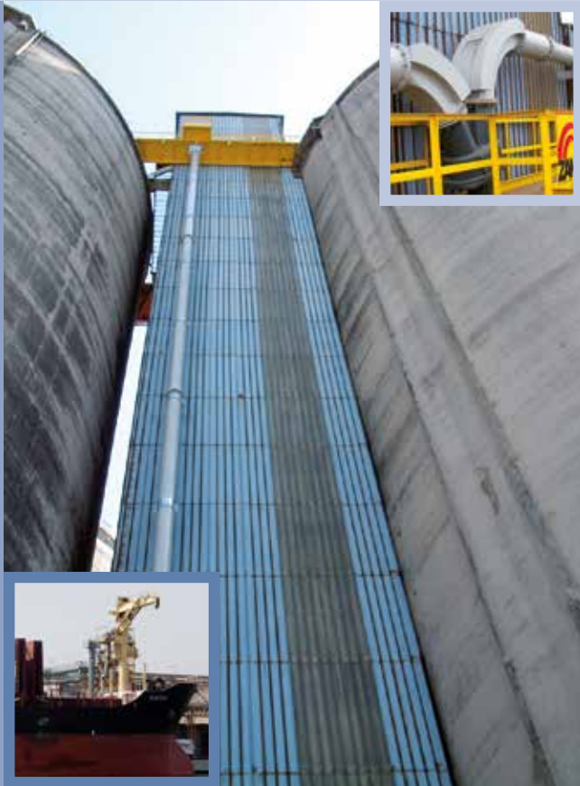
■ Carico trasporto pneumatico da nave a silos altezza 60 metri