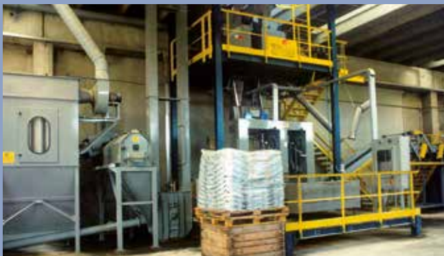
■ Linea insacco