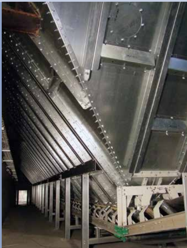
■ Tramoggia di ricezione con nastro trasportatore