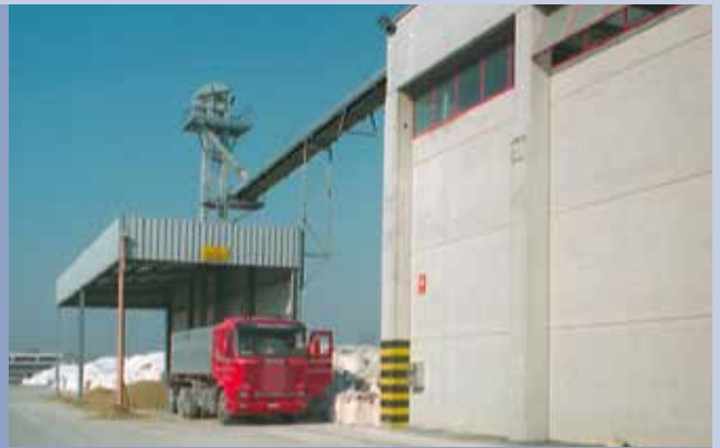
■ Scarico alla rinfusa da camion