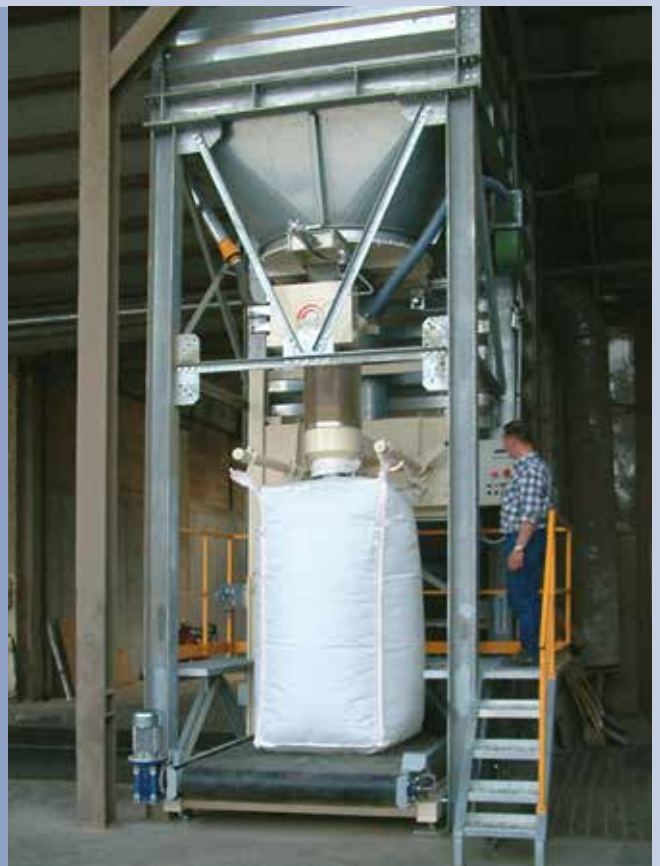
■ Insacco BIG BAGS a peso lordo