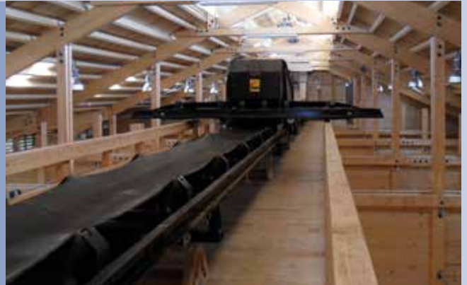
■ Carico celle magazzino