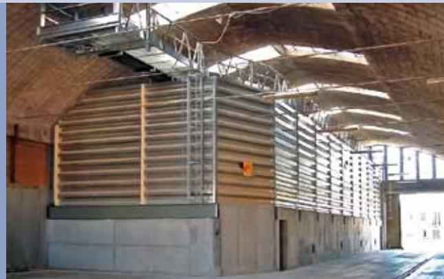
■ Silos celle quadrate